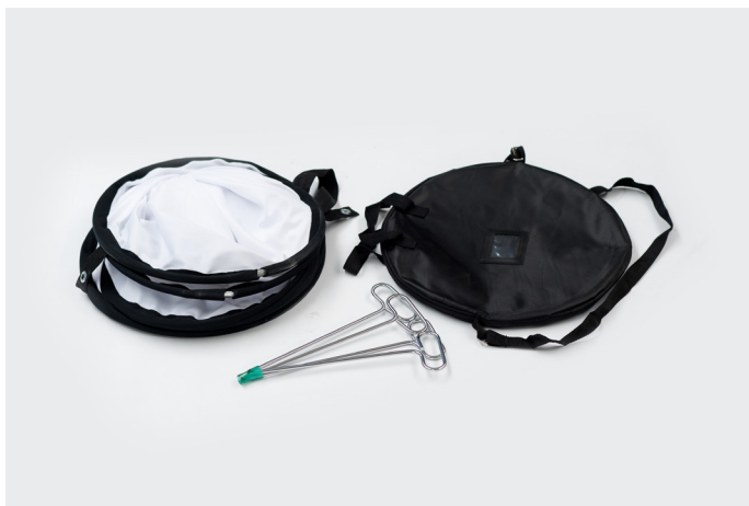
Leveres med 4 stk. pløkker, samt en smart taske til sikker opbevaring og transport